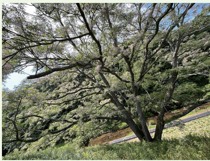
広島に水俣曼荼羅(6時間超のドキュメンタリー映画)を鑑賞にく中の大きなセンダンの。