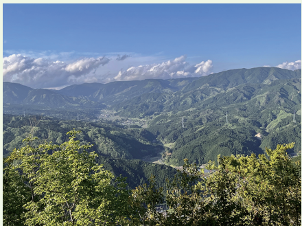
津山市北部の矢筈山。756m からの展望です。