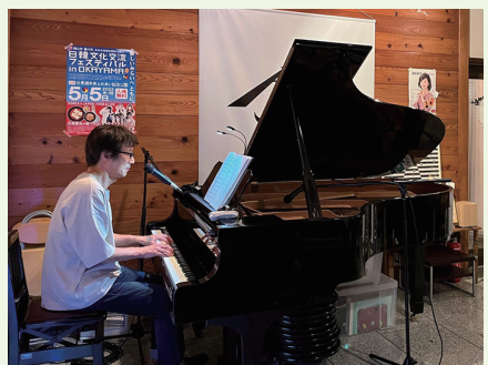
2022年5月には倉敷の富士のやさんでワンマンライブ。