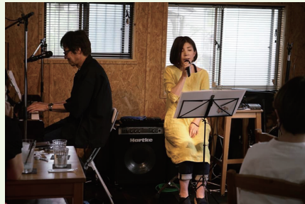
千屋のCafé & Live, MUSIKさんで、Berry with TCMとして参加しました。