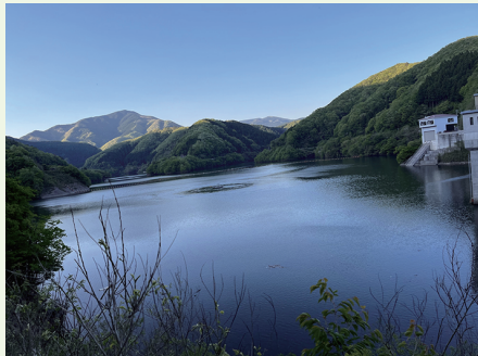
岡山県新見市の千屋ダムです。周囲を散策しました。

このコラムについては、二か月分なのでリアルタイムでは、様子をお伝え出来ません。一年前の様子を中心に。そして、午後休診とか休みの日は、あちこち出掛けてもいます。そんな季節便りを。